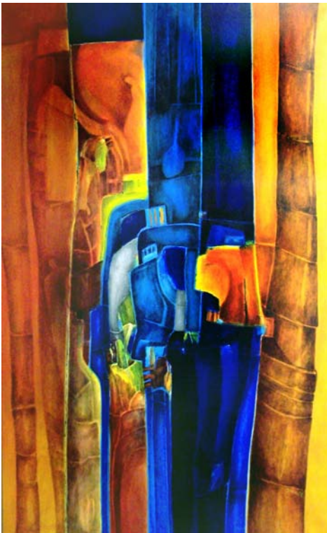
"Kult-Ur-Sache III" , Mischtechnik, 160 x 100 cm