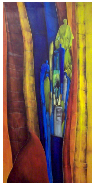
"Lebens-Welt II" , Mischtechnik, 200 x 100 cm