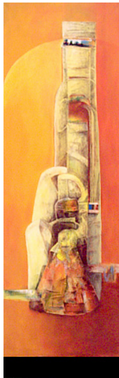
"Kult-Ur-Sachen I" Mischtechn., 210 x 70 cm