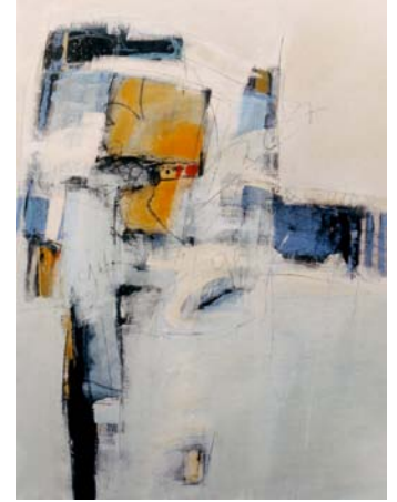
"TODAY" , Mischtechnik, 120 x 100 cm