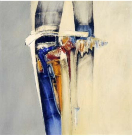
"Industrial Landscape III" Mischtechnik, 80 x 80 cm