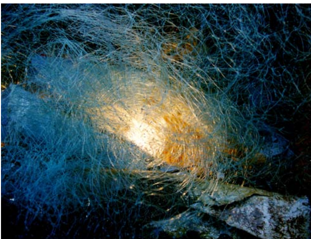
"LIGHT V" , Fotografie